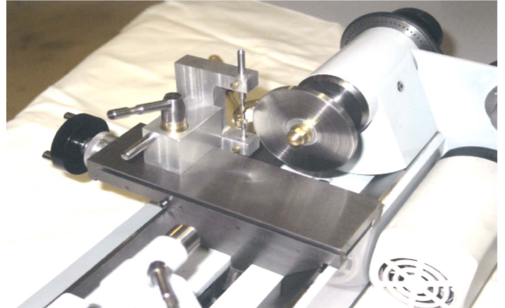
Dispositivo di rettifica dell'ancora del pendolo